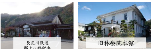
長良川鉄道 郡上八幡駅舎