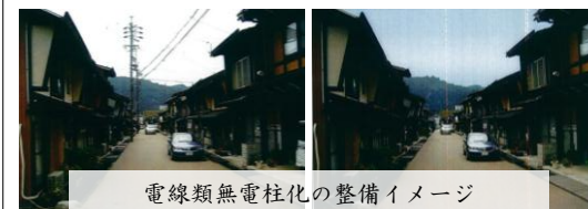
電線類無電柱化の整備イメージ

重点区域内の3路線において、景観向上や市街地交通の円滑化とともに、災害発生時の緊急対応能力の向上のため電線類の地中化を行う。