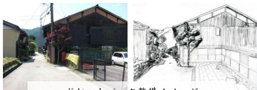
ポケットパーク整備イメージ

市道に隣接する公共施設（八幡公民館）の駐車場にポケットパークを整備する。また、歴史的風致やマナー啓発に関する情報を掲示する。