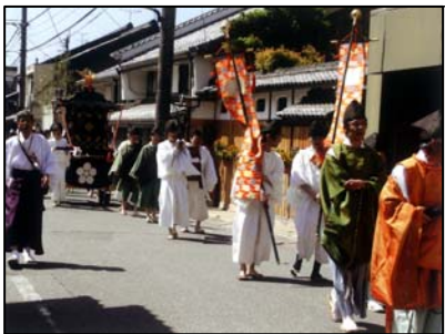
魚屋町での天神祭り