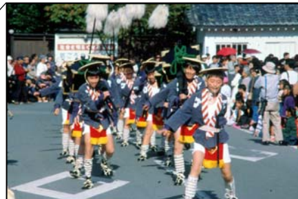
小江戸彦根の城まつり