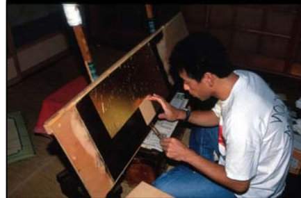
七曲りのまちなみと仏壇職人