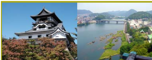
■国宝犬山城と名勝木曾川

370余年もの長い年月の間、町衆らにより大切に守り伝えられてきた犬山祭の祭礼儀式（重要無形民俗文化財）と、その背景または舞台となっている国宝犬山城や城下町の歴史的な町並みが今なお一体となって残り受け継がれている光景が、犬山を代表する歴史的風致といえる。