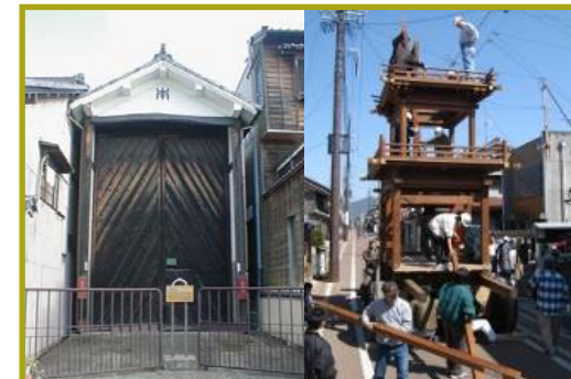
■車山蔵と車山の組立て