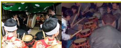
■お囃子の演奏とその練習