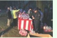
毘沙門堂だるま市

市内北東部の奈古谷地区には、臨濟宗の古刹「国清寺」と、その祠堂である「毘沙門堂」がある。毘沙門堂では、1月3日に「だるま市」が行われており、毘沙門堂へと続く「毘沙門道」は、だるまを求める参詣者が多数行きます。奈古谷集落内の「観音堂」では、毎月17日の夜、地元的女性たちによる「観音講」が開かれています。