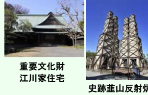
重要文化財 江川家住宅

江川英龍は、江戸時代末期に幕府の代官として民政や海防の分野で活躍し、その多彩な功績と高潔な人柄から、郷土を代表する偉人の一人として市民に親しまれている。英龍を輩出した江川家の屋敷である「江川邸」(重要文化財江川家住宅)では、「具足開き」や「御会式」などの伝統行事が、江川家と地元金谷地区の人々によって営まれている。英龍が製鉄大砲製造のために築造した「韭山反射炉」(史跡・世界文化遺産)は、地元の人々を中心とした保存運動や継続的な顕彰活動を通じて今日まで継承された、伊豆の国市のシンボルである。また、江川邸と韭山反射炉がある地域には、江川家にゆかりのある神社や寺院が複数存在し、祭礼などの営みが続けられてきており、総体として郷土のアイデンティティーの源泉とも言える歴史的風致を形成している。