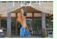
守山八幡宮 三番叟

韭山地域原木の荒木神社、寺家の守山八幡宮、大仁地域田京の広瀬神社、三福の熊野神社大仁の大仁神社には、能楽「翁」に由来する民俗芸能「三番叟」が伝承されている。五穀豊穡を願うものとして、秋の例大祭で奉納される三番叟は、神輿や山車の巡行とともに、地域の人々により、大切に伝えられている。