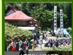
大西神社と山城の経踊