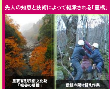
先人の知恵と技術によって継承される「蔓橋」