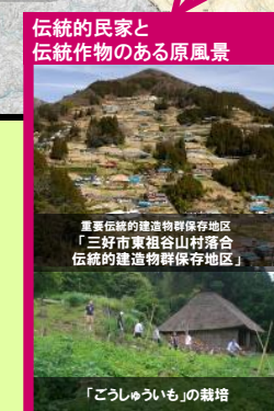
伝統的民家と伝統作物のある原風景