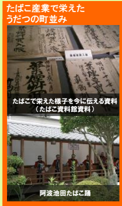
たばこ産業で栄えたうだつの町並み

三好市の歴史的風致は、平家落人伝説を育んできた祖谷地方と伝統産業で栄えた吉野川流域に一体となって継承されている「伝統文化」そのものである。