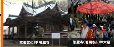
重要文化財「箸蔵寺」