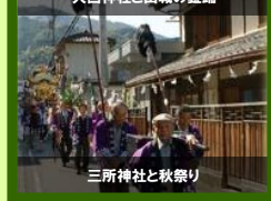
三所神社と秋祭り