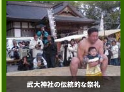
武大神社の伝統的な祭礼