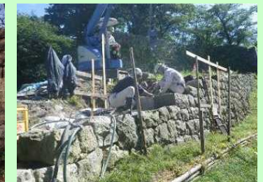
村上城跡石垣修復作業