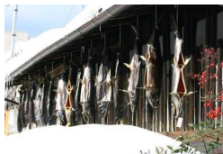
町家の軒下に吊るされた塩引き鮭

三面川の鮭は、村上藩の財政を支えながら城下の形成発展に寄与し、現代に至るまで多様な文化や生業を育むとともに関連文化が現在まで受け継がれている。