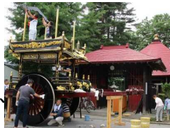
しゃぎり屋台の組み立て

村上大工が携わる社寺や武家住宅、町家などの修復作業や彫漆工芸の代表作である村上まつりのしゃぎり屋台の点検、修理する風景は社寺や町家などの町並みと一体となり歴史的風致を形成している。