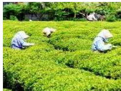
市街地内の茶畑での茶摘み作業

市街地内の茶畑での茶摘み風景や新茶の時期に町中に広がる茶の香りはこの地域の季節の風物詩であり町中で季節を感じる歴史的風致となっている。