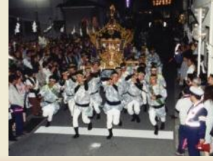
松原神社神輿の宮入

旧くは三大明神と称された松原神社、居神社、大稲荷神社で行われる例大祭では、それぞれの歴史と伝統を受け継いだ神輿を担ぐ氏子たちの勇壮な姿や木遣りの甚句、お雛子の笛の音などが今も賑やかに行われ、周辺の地域と一体となって良好な環境を形成しています。