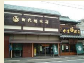
出桁造りの伝統的商家

東海道屈指の宿場町であった小田原の台所を担った千度小路周辺には、蒲鉾や削り節、干物などの製造・販売を行う伝統的な商家やそれらの店舗が多く集積するかまぼこ通りと呼ばれる通りなどがあり、そこで行われる歴史と伝統を今に受け継ぐなりわいと一体となって良好な環境を形成しています。