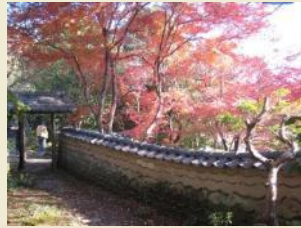
老櫓荘からみた紅葉

板橋地区周辺には、小田原北条氏の時代から続く社寺群や近代に相次いで建てられた政財界人たちの別邸などが良好なまちなみの中に残り、そこでは古くから庶民に信仰されてきた宗教行事や民俗行事が今も行われています。