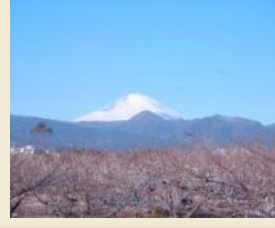
曾我梅林と富士山

伝統的な梅の栽培が行われる曾我梅林を中心とした地域は、梅の木々や梅香、梅干製造などの農家の営みとが一体となって独特な景観を形成しています。