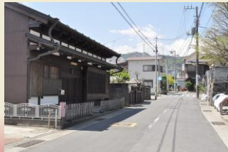
板橋地区周辺 のまちなみ