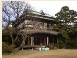
小田原文学館別館 (白秋童謡館)