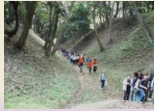
今も残る総構の遺構 (小塚御鐘ノ台大堀切東堀)

小田原城八幡山古郭・総構の保存活用等を図ることにより、城下町と一体となった歴史的環境の形成を促進します。