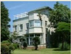
小田原文学館本館

国登録有形文化財である小田原文学館（本館・別館）の修繕を実施し、周辺の歩行者空間の整備等とあわせて、まちなかを回遊する際の休憩施設としての機能を付加する整備を行います。