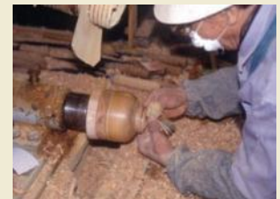
小田原漆器製造の様子

小田原漆器をはじめとする伝統工芸は、それぞれの歴史と伝統を受け継ぎながら現在も行われ、小田原に住む人々の生活などと一体となって良好な環境を形成しています。