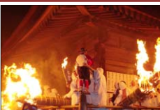
滝山寺鬼祭り(火祭り)▶

鎌倉時代、源頼朝の祈願に始まると伝えられている滝山寺鬼祭りは、旧暦正月7日に行われる火祭りです。重要文化財の滝山寺の境内地を舞台に鬼が乱舞する勇壮な祭りとして、地域に受け継がれている。