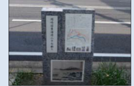
■資源等の説明看板

歴史文化資産の周辺など来訪者の多い場所において、歴史文化資産の紹介や観光ルート等に関する案内板の新設・改修・修繕を行う。