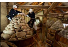
味噌蔵での石積み▶

旧東海道を挟んで建つ2軒の老舗が昔ながらの伝統製法により製造する豆味噌は、かけがえのない故郷の味であり、まちを歩くとほのかに漂う味噌の香りとともに、蔵造りのまちなみ景観が風情を漂わせている。