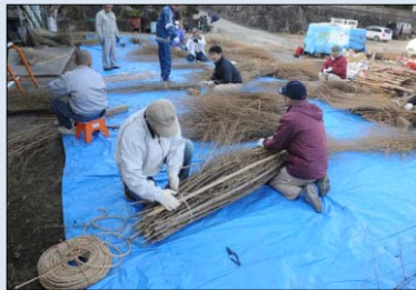
■松明作り(滝山寺鬼祭り)

民俗文化財の調査や記録、情報発信、また民俗文化財の活動を支援し、文化財の保存・継承及び地域の活性化を促進する。