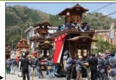
須賀神社から神明宮への祭礼山車巡行▶

市東部山地にある額田地区では、自然条件に適応し営まれてきた様々な民俗行事が社寺や集落を舞台として伝えられ、個性豊かな山里のくらしが今も息づいている。