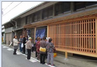
■景観重要建造物(修景後)

景観重要建造物又は歴史的風致形成建造物の外観の保全に係る修理・修景に対して支援する。