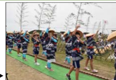
六ツ美悠紀斎田お田植え踊り▶

古くから農業が盛んな六ツ美地区には、「御田扇祭り」、「六ツ美悠紀斎田お田植えまつり」の稲作儀礼が受け継がれ、田園地帯の集落の風景に農作業や祭りを行う人々の営みが調和している。