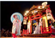
能見神明宮の山車舞台での奉納の舞▶

江戸時代の町割りの一部や社寺の境内がそのまま残る旧岡崎城下を舞台に、当時から連綿と行われてきた華やかな祭りが、往時の賑わいを感じさせている。