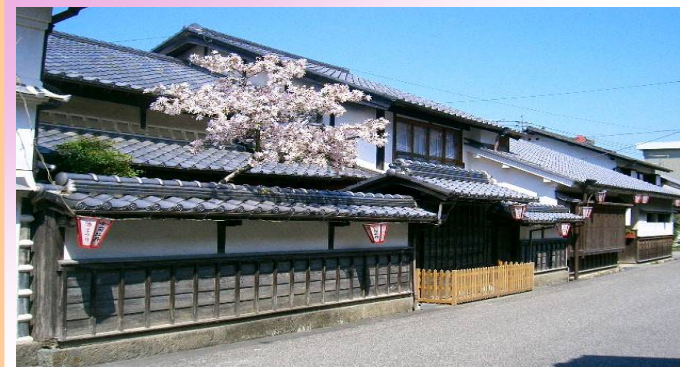
竹村家住宅（国指定重要文化財）