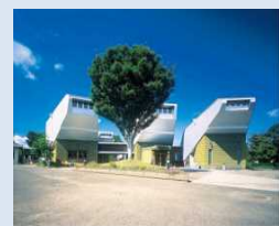
■ 湯前まんが美術館

歴史文化を総合的に発信していく湯前まんが美術館の利便性や展示機能の拡充に取り組み、歴史文化の普及や観光振興を推進する。