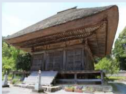
みょうどうじあみだどう ■ 明導寺阿弥陀堂

歴史的建造物の維持保全を図るため、重要文化財の明導寺阿弥陀堂の茅葺屋根修繕と九重石塔の修繕等を行う。