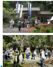
さがらさんじゅうさんかんのん 相良三十三観音めぐり

また、巡礼者が白衣姿で「御詠歌」として札所の名前を詠み込んだ歌を唱え巡礼する光景は、球磨地域に本格的な季節の訪れを告げるものとしてその歴史と伝統を今に伝える。