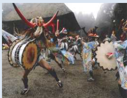
ひがしかたぐみたいこおど ■ 東方組太鼓踊り

東方組太鼓踊りや浅鹿野棒踊り等の無形民俗文化財の継承活動等に支援を行い保存及び地域の活性化を促進する。