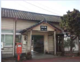
ゆのまええき ■ くま川鉄道湯前駅

方針に基づき指定した歴史的風致形成建造物において、歴史的風致の維持及び向上に必要な改修等の支援を行う。