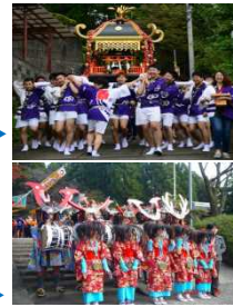
おみこしかつ 大神輿担ぎ ひがしかたぐみたいおど 東方組太鼓踊り

遥拝所として再興された後も、本町の総氏神的存在として「里宮さん」の愛称で親しまれ、春秋の大祭では、町内を神輿が練り歩き、球磨神楽や臼太鼓踊り、棒踊りといった伝統芸能が奉納され、人びとの心のよりどころとして地域に欠かせない存在となっている。