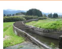
こうのみぞ 幸野溝(水路橋)

疏水幸野溝は、江戸時代の新田開発とともに造られたもので、水害による堰の流失など難工事の末、宝永2年(1705)に完成した。その偉業は、球磨地域を有数の農業地帯に発展させ、人吉藩の石高増収につながり、現在でも耕作地や水路では祭礼行事が行われ、防災上も地域の重要なかんがい施設となっている。