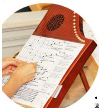
◀ ヘルマンハーブ 画像は日本ヘルマンハーブ公式サイトより https://www.hermannharp.com/beginner/index.html

多様な主体で構成するコンソーシアムにおける学習支援のあり方の検討を踏まえて、実施されるプログラムのうち、県生涯学習センターにおける取組では、音楽の学習プログラムを開発する。障害者でも演奏しやすいヘルマンハーブを活用したワークショップを実施。