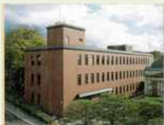
京都国立博物館修理所 昭和54年竣工、築41年