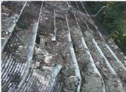
重要文化財 石城神社本殿(山口県) 屋根が腐食し、穴があいた状態 (事業期間: R3.11月～R4.11月)