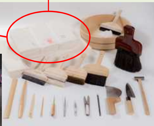
簀・桁 その材料となる萱(かや)・竹ひご・編糸・桁の取手の金具なども生産量の減少に陥っている。