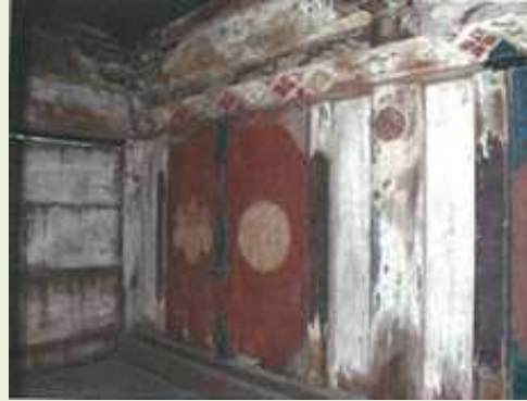
重要文化財 泉井上神社(大阪府) 経年劣化が進行し、退色・剥落が 進行している状態 (事業期間: R2.9月～R4.8月)