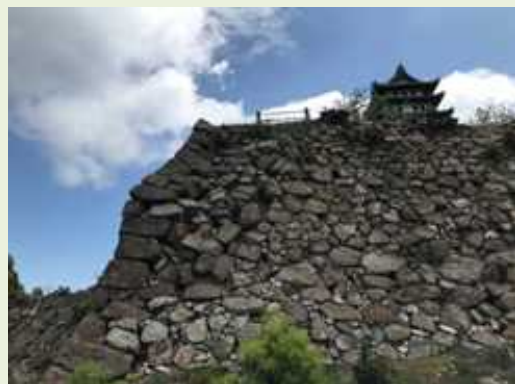
史跡 洲本城跡(兵庫県) 孕み出しが進み崩落の危険がある 石垣 (事業期間:H16~R33)