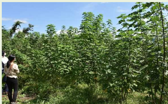
楮(こうぞ) 生産には手間暇がかかる