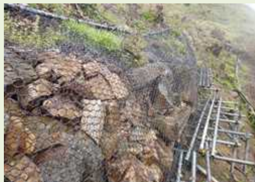
史跡 富田城跡(島根県) 孕み出しが進み落石防止ネットで 応急措置された石垣 (事業期間:H26~R3)