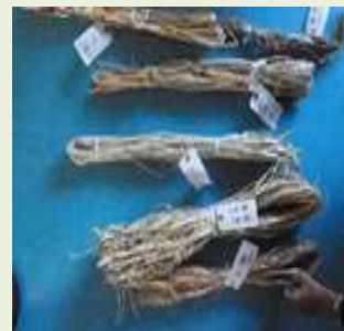
原料に係る調査研究の実施 (安定的供給など)