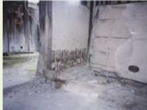
重要文化財 旧西尾家住宅(大阪府) 壁の剥落が進行し、著しく傷んでいる 状態 (事業期間: R2.6月～R12.3月)

木造の重要文化財(建造物): 2,155件(R3,2,1現在) ・令和2年度修理要望件数: 153件 ・令和2年度事業採択件数: 132件(86.3%)