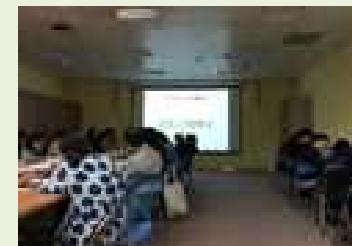
文化財修理に関する研修 (イメージ)