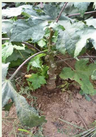
トコロアオイ 楮同様、手間がかかるため、一昨年には生産の危機に瀕した。