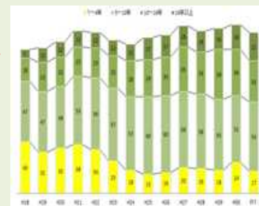
(一社)国宝修理装潢師連盟加盟工房修理技術者(装潢分野)数の推移

修理技術者の養成が十分に行われていない。10年近登録修理技術者数は横ばい(若年層の減少)