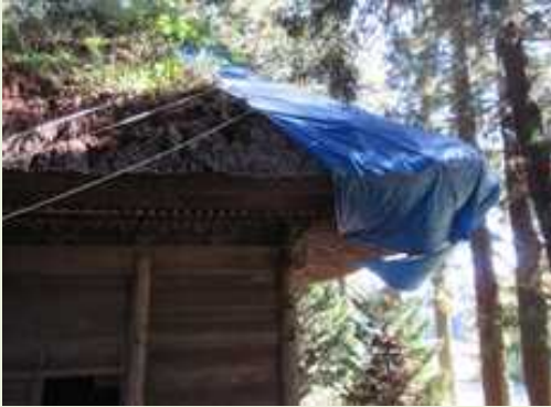
重要文化財 清水寺観音堂(青森県) 茅の腐食が進行し、雨漏れが生じている 状態 (事業期間: R2.4月～R3.10月)