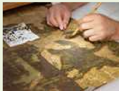
新たな技術の開発と導入 (絹本絵画の肌裏紙除去)