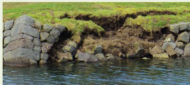
石垣が崩落した状態 (実績) 事業期間:平成28年度 事業経費:5,098万円