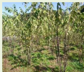
和紙の原料・コウゾ

修理技術者の養成が十分に行われていない。10年近登録修理技術者数は横ばい(若年層の減少)