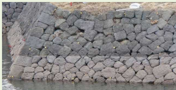
修理が必要な状況まで孕んだ状態 (計画) 事業期間:平成26年度 事業経費:4,080万円