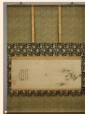
表装裂を使用した掛軸