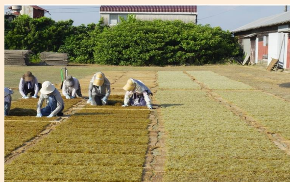
フノリ加工の様子