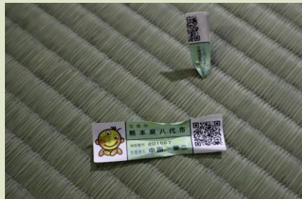
国宝建造物における保存修理事業での国産畳の使用