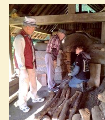
白炭製炭等実技体験会の様子

技術名称: 木炭製造 保存団体: 合同会社伝統工芸木炭生産技術保存会 後継者確保や社会的認知度の向上を目的とし、大学生や一般を対象とした、黒炭、白炭の製炭等実技体験会を実施。