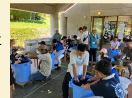
藍染体験会の様子

技術名称: 琉球藍製造 保存団体: 琉球藍製造技術保存会 研修で製造した琉球藍を用いて、海洋博公園にて、一般向けの藍染体験会を開催。県内外から多数の参加者があり、琉球藍の周知に貢献。 ※令和7年度の参加者 431人