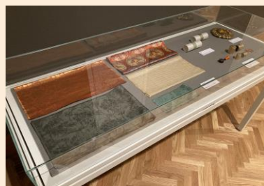
「日本国宝展」における展示の様子