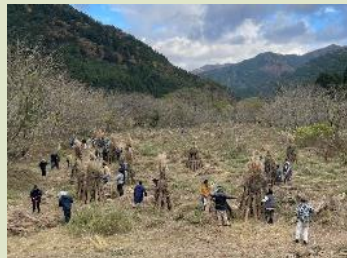
(一社)日本茅葺き文化協会 茅刈り体験研修