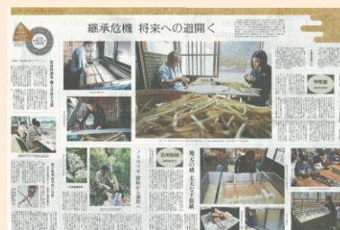
修理の用具・原材料について 紹介する新聞記事