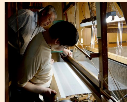
表装裂の製作の様子