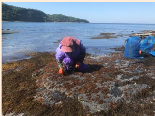
フノリ収穫の様子