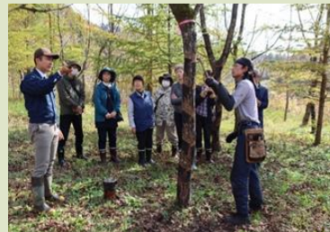
日本うるし播き技術保存会 漆播きの体験