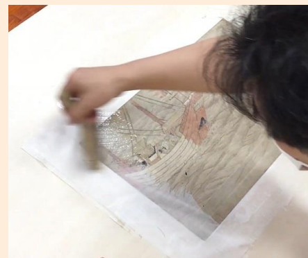
フノリを使用した表打ちの作業の様子