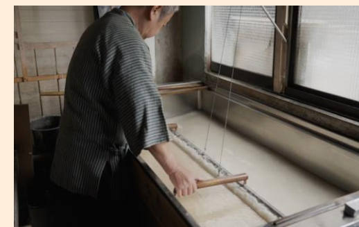
宇陀紙の製作の様子