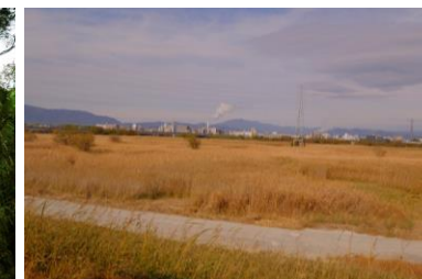
伏見宇治川ヨシ場【茅(ヨシ)】 (京都府)R6設定地