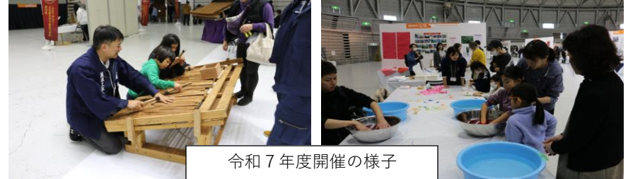
令和7年度開催の様子