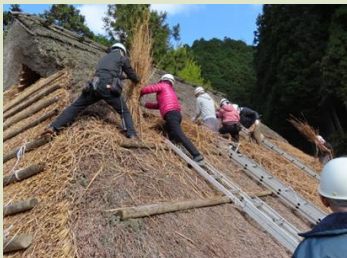
(NPO法人)文化遺産保存ネットワーク河内長野 檜皮葺体験の様子