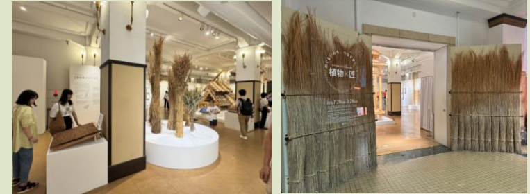
展覧会「植物×匠」の様子