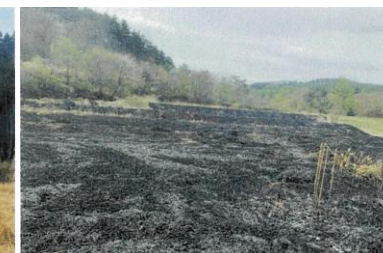
遠野茅場【茅】(岩手県) 管理業務支援による山焼の様子(左実施前→右実施後)