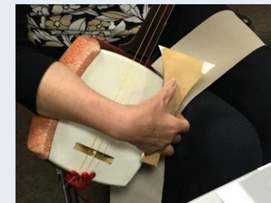
象牙代替品を用いた 三味線撥の試奏の様子

新素材の開発によって三味線の胴皮の選択肢(種類)を増やすことが、皮材の安定的な供給につながる。