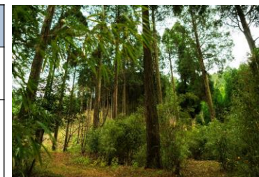
阿蘇南郷檜の森【木材(ヒノキ)】 (熊本県)R5設定地