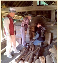
↑ 白炭製炭等実技体験会の様子

技術名称: 木炭製造 保存団体: 合同会社伝統工芸木炭生産技術保存会 後継者確保や社会的認知度の向上を目的とし、大学生や一般を対象とした、黒炭、白炭の製炭等実技体験会を実施。