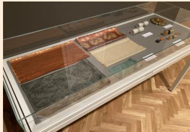
↑ 「日本国宝展」における選定保存技術コーナーの様子