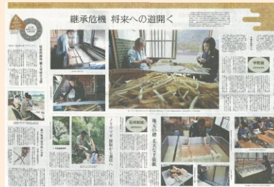
↑ 文化財修理について紹介する新聞記事