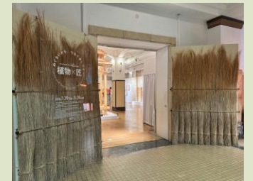
↑ 展覧会「植物×匠」の様子