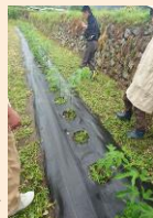
植物の専門家によるコウゾ畑調査の様子⇒