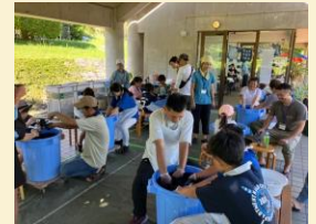
↑ 藍染体験会の様子

技術名称: 琉球藍製造 保存団体: 琉球藍製造技術保存会 研修で製造した琉球藍を用いて、海洋博公園にて、一般向けの藍染体験会を開催。県内外から多数の参加者があり、琉球藍の周知に貢献。 ※令和7年度の参加者 431人