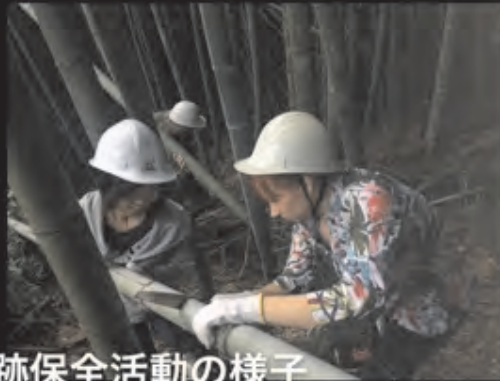
基金を用いた遺跡保全活動の様子