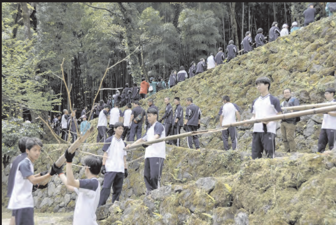
地元高校(ユネスコスクール)による遺産保全活動