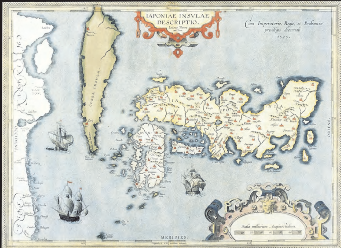
ティセラ/日本図 (1595年)

■ : 銀鉱山跡と 鉱山町 ■ : 街道 ■ : 港と港町 ii · iii · v