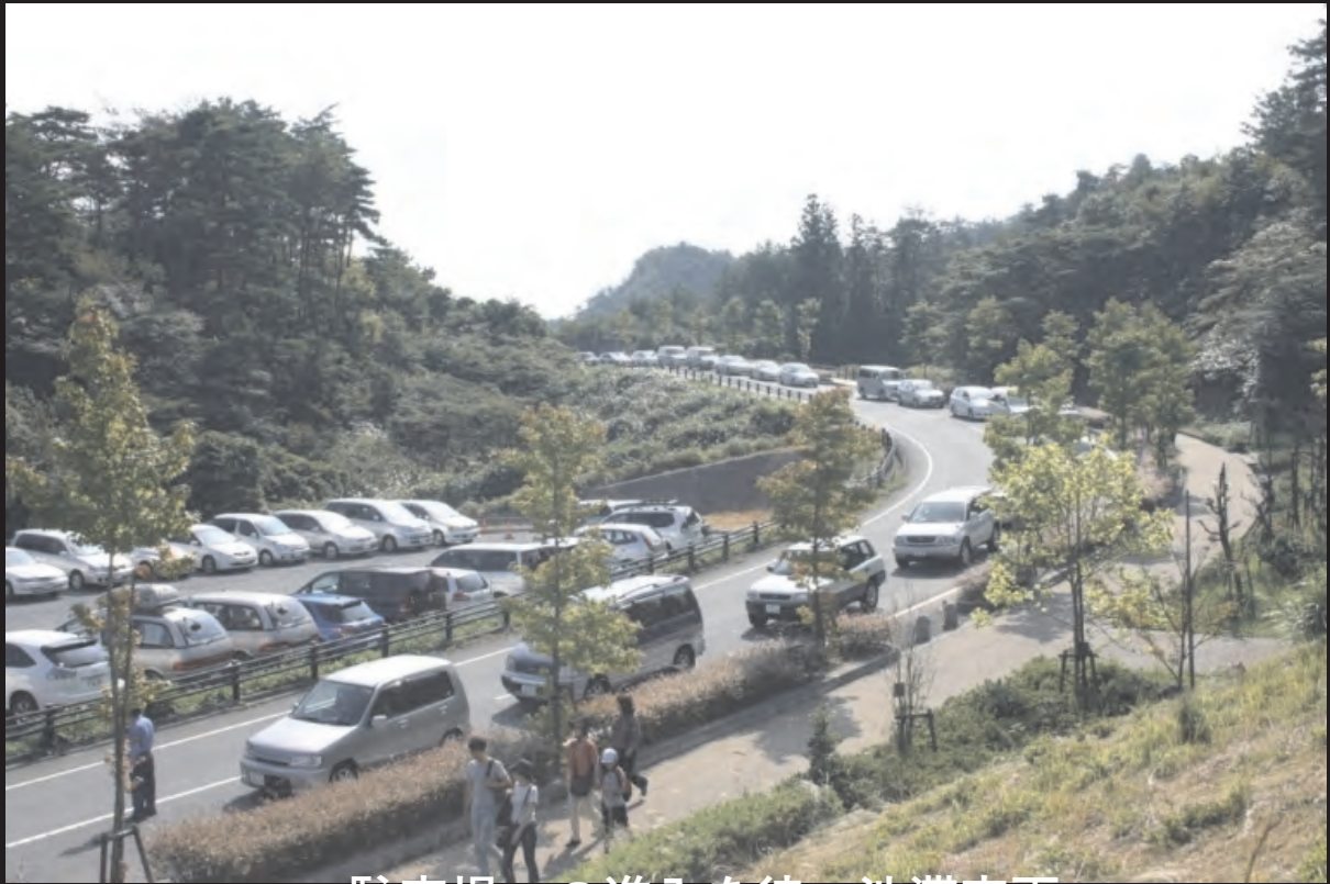
駐車場への進入を待つ渋滞車両