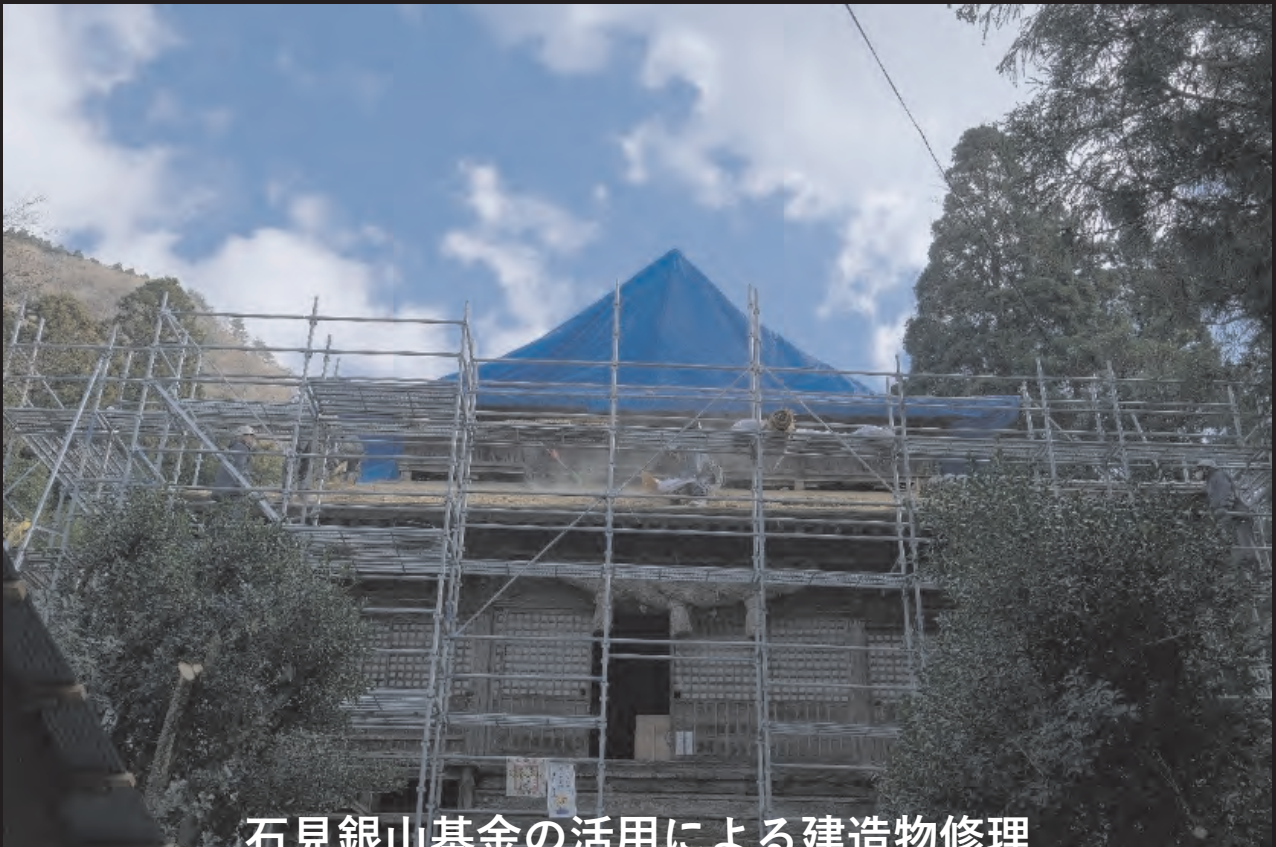
石見銀山基金の活用による建造物修理