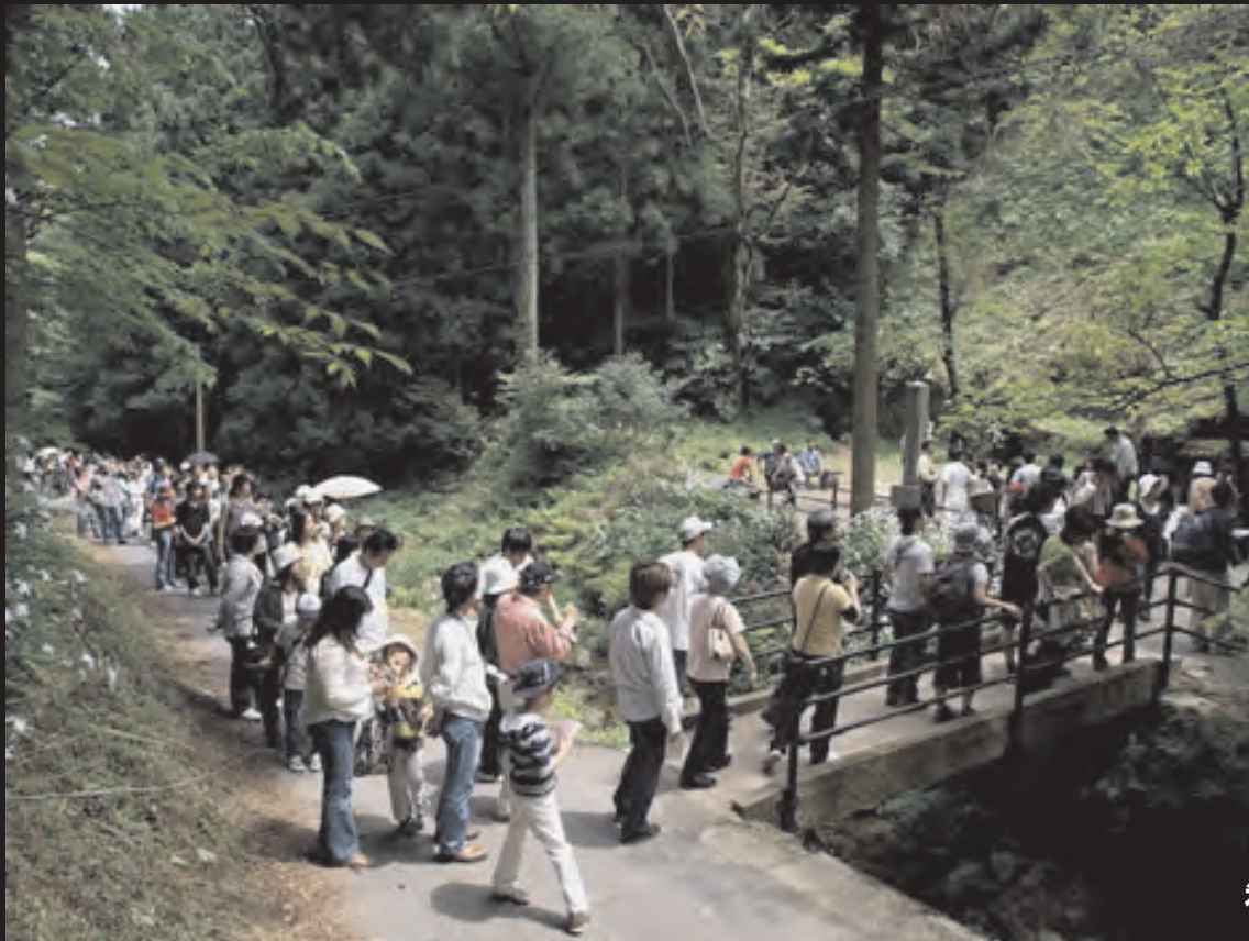
観光坑道入口付近 12