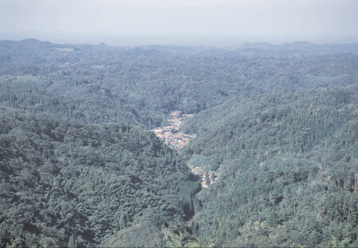
自然と共生した土地利用と活動の痕跡を留める “石見銀山の文化的景観”