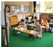
(文化庁委託事業による地域の日本語教室の例)