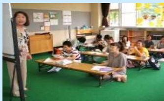
(地域の日本語教室の例)

都道府県・政令指定都市が、関係機関等と有機的に連携しつつ行う、日本語教育環境を強化するための総合的な体制づくり、地域日本語教育の実施(市町村への支援を含む)を推進する。