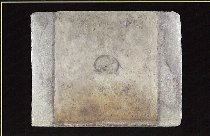
北壁玄武が描かれた石材