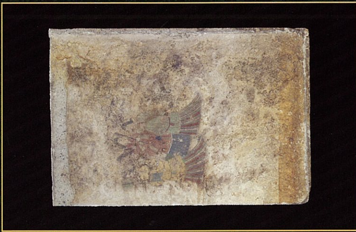
西壁女子群像が描かれた石材