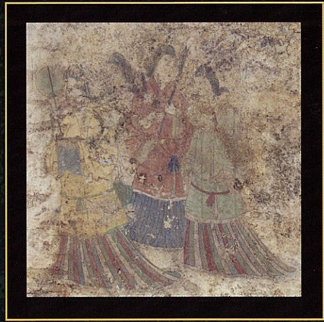
西壁女子群像(拡大)