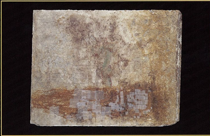
東壁青龍が描かれた石材