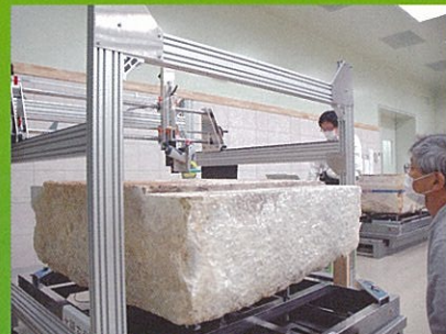
科学分析(顔料等調査)の様子