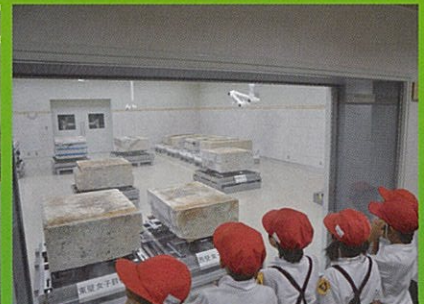
平成21年の公開時の様子