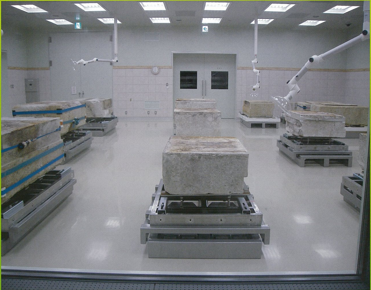
見学用通路の窓ガラスから見た修理作業室内