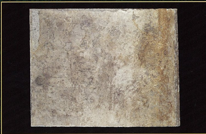
西壁白虎が描かれた石材