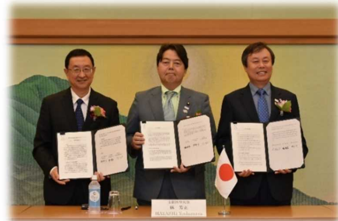
〈三大臣による署名文書披露〉