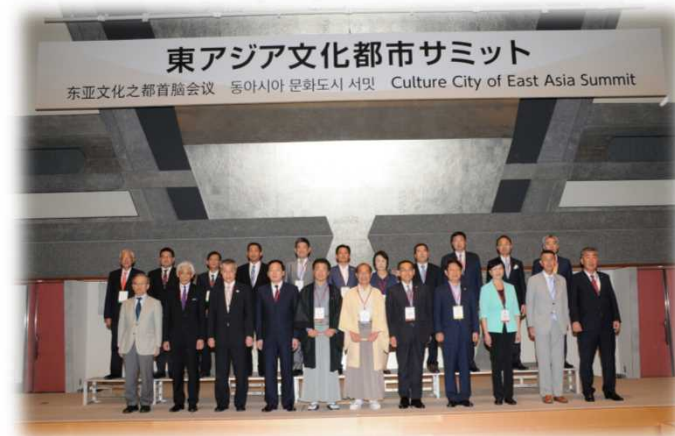
<東アジア文化都市サミット(第1回)集合写真>