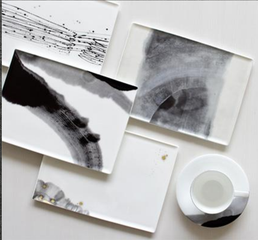
「墨の瞬（すみのとき）」 ニッコー株式会社（石川県白山市）