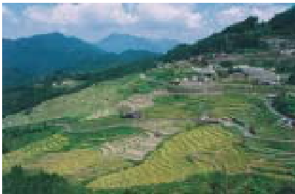
丸山千枚田(三重県)