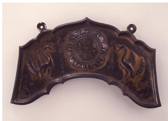
◎金銅孔雀文磬 (鎌倉時代・建保元年〈1213〉)