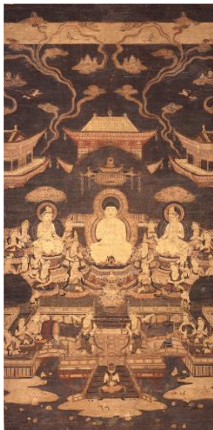
◎絹本著色智光曼荼羅図(鎌倉時代)