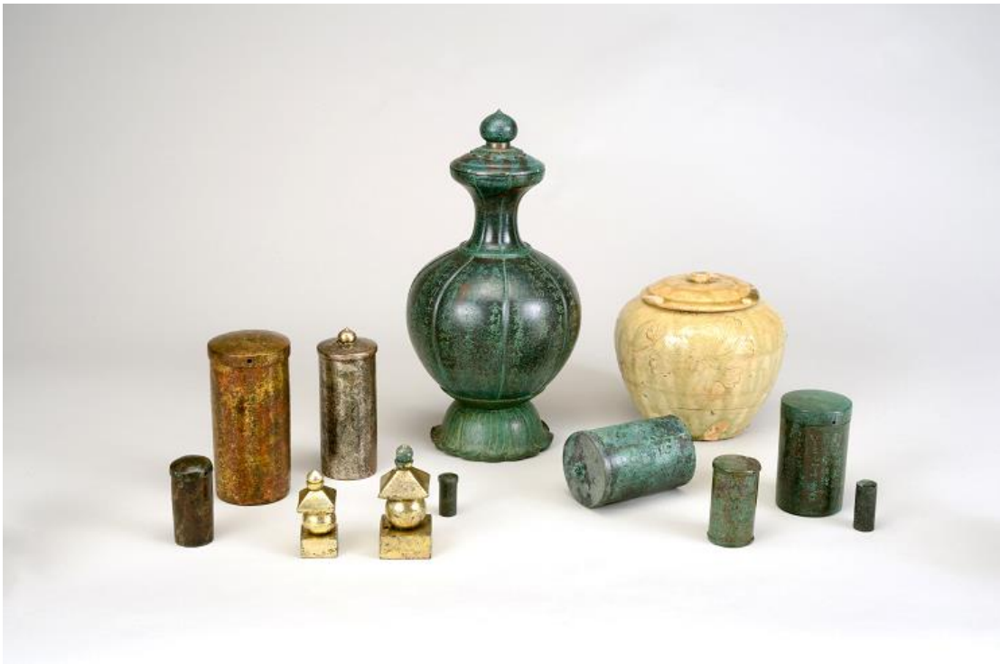
◎大和額安寺五輪塔納置品(鎌倉時代・嘉元元年〈1303〉, 嘉暦元年〈1326〉)