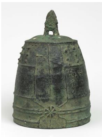
◎梵鐘 (平安時代・貞元2年〈977〉)