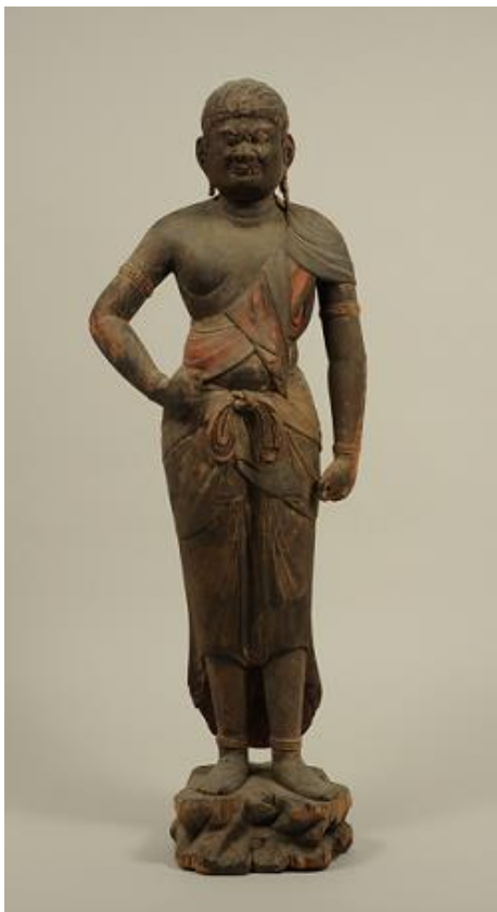
◎木造不動明王立像(平安時代)