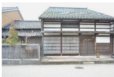
[ 修理後 ]