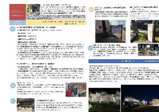
[ まちづくりだより ]