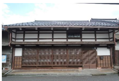
[ 修理後 ]