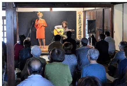
みのりあん 農庵:ライブイベントの様子