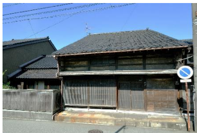
[ 修理前 ]