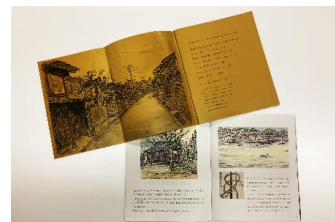
[ 絵本 ]

これまで“まちづくりだより”の発行や住民主体のまちづくりに向けた意識醸成を目的とし住民アンケートを実施した。今後はガイドマップの作成、重伝建地区を誇れるボランティアガイドの養成を行う予定である。(吉久まちづくり推進協議会会長 70代男性)