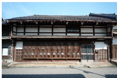
[ 修理前 ]