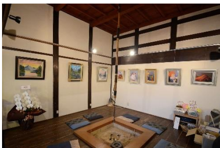
さまのこ屋〈陶工房と喫茶〉

地元住民が、解体される予定であった空き家と土地を取得し、陶工房と喫茶を始め、伝統的な町家の中で食事ができるスポットとして注目を集めている。近年は、他の地区住民も空き家を取得し、保存地区内で催しものを行うことができる町家として公開している。