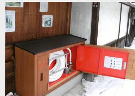
易操作性1号消火栓