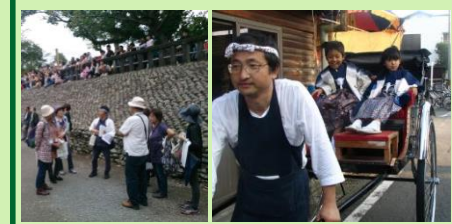
町並みのイベント支援 (町並み案内・人力車運行)