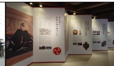
情報発信施設の整備(造り酒屋跡の取得・整備)