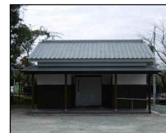
来訪者用トイレ整備