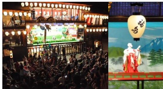
(八女福島の燈籠人形)

9月には、地区内の福島八幡宮の境内で、重要無形民俗文化財「八女福島の燈籠人形」が公演されるのに合わせて、「八女のまつり、町屋まつり」が開催され、伝統工芸の技術や保存地区の魅力の発信が行われている。