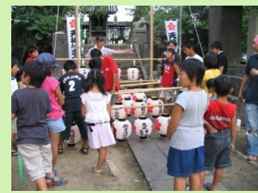
伝統行事の復活の取組み (天神さんこどもまつり)