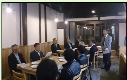
町家の活用支援 (新規オープン店舗のお披露目会)