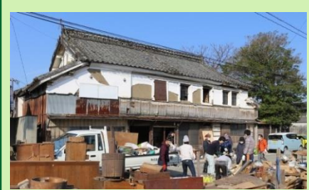
空き家の活用支援 (空き家の大掃除ワークショップ)