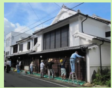
町家のメンテナンス支援 (柿渋塗りワークショップ)