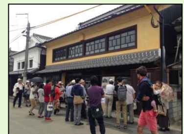
町並みの広報活動 (修理が完了した建物の見学会)