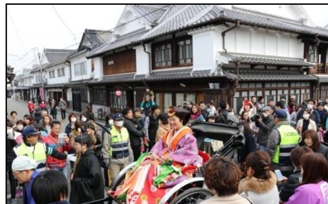
(結婚式～おひなさまパレード～)

9月には、地区内の福島八幡宮の境内で、重要無形民俗文化財「八女福島の燈籠人形」が公演されるのに合わせて、「八女のまつり、町屋まつり」が開催され、伝統工芸の技術や保存地区の魅力の発信が行われている。