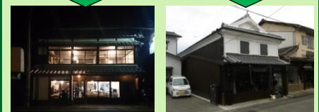
空き町家の再生・活用