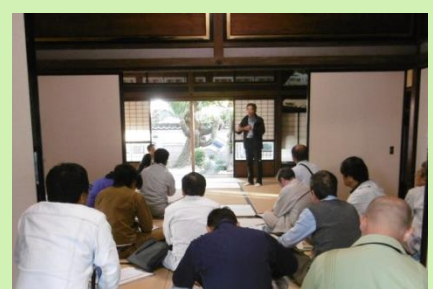
伝統工法の研修会の開催