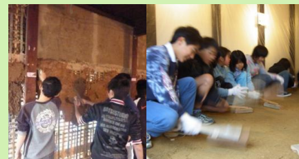
小学生の伝統工法体験 (荒壁塗り・土間たたき)