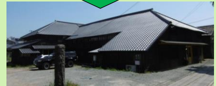
旧八女郡役所の再生・活用