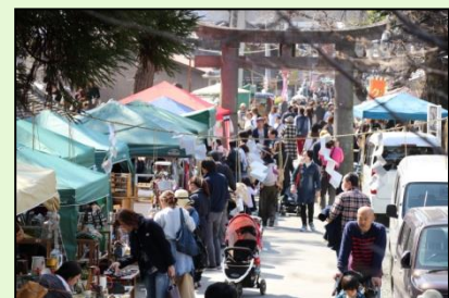
町並みイベントの支援 (テラコヤノミノイチ)