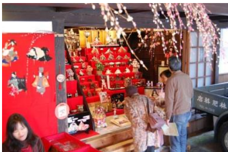
筑後吉井おひなさまめぐり