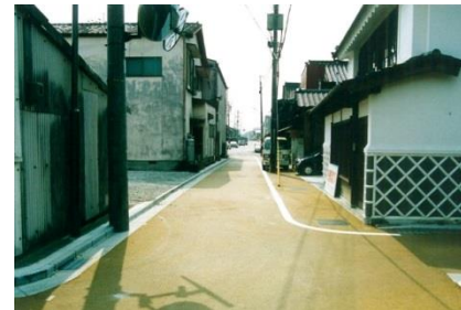
道路のカラー舗装(美装化)