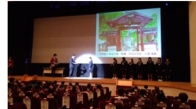
町並み絵画コンクール 表彰式