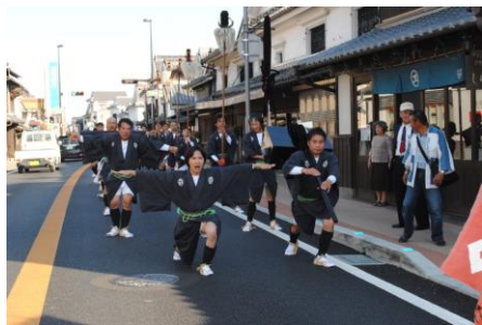
若宮おくんち毛槍行列