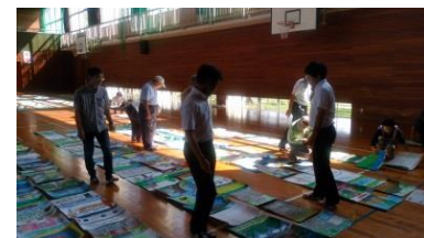
町並み絵画コンクール 審査会

筑後吉井伝建地区に居住する住民が会員となり、旧豊後街道の在郷町として栄えた吉井町の町並みを整備し、潤いのある町づくりを推進する住民団体です。