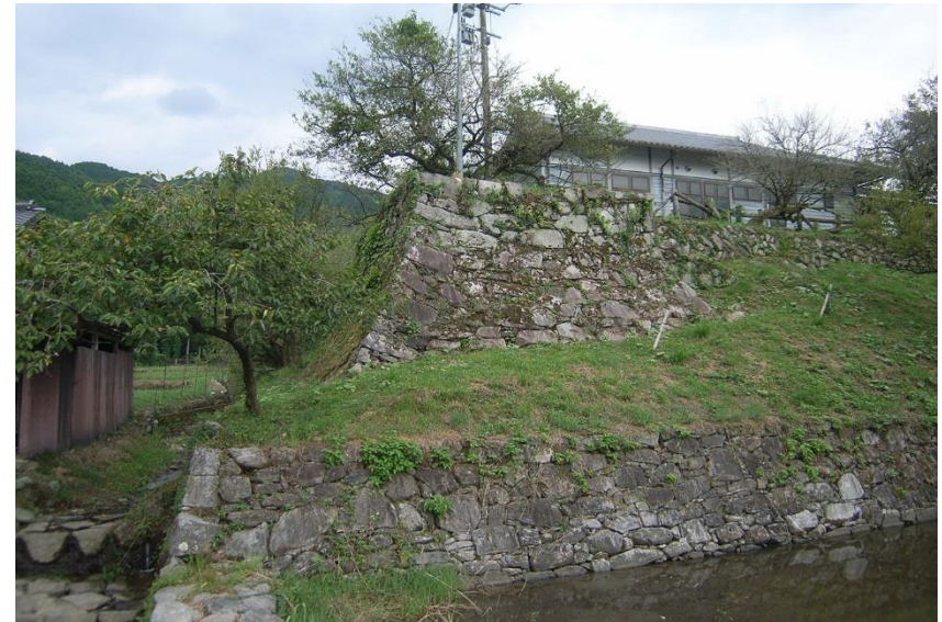
秋月城跡：城跡の西に秋月の町並みが広がる。