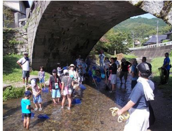
市民講座：秋月の河川(水利)の見学会を実施