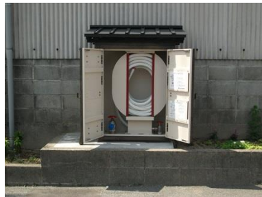
消火栓：景観に配慮した消火栓を70基設置