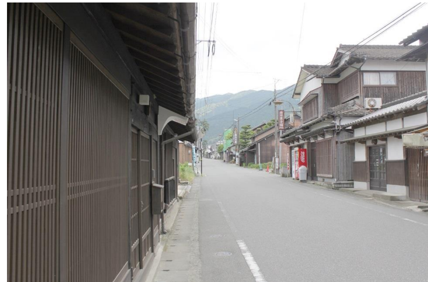
秋月の町並み：約400mに渡り街路に直接主屋が面する。