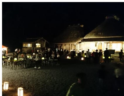
かやぶき屋根のお月見会