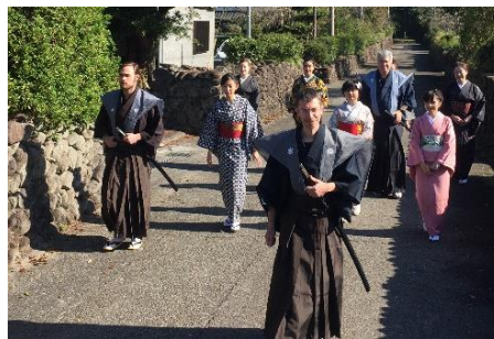
サムライツーリズムの様子

入来麓地区に興味を持ち訪れてくれる観光客への「おもてなし」についてよりよい方法を考え、実施できるよう取り組んでいます。