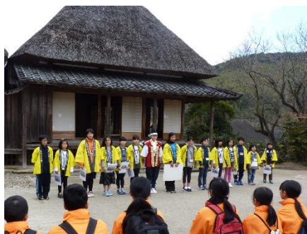
入来小学校歴史ジュニアガイド