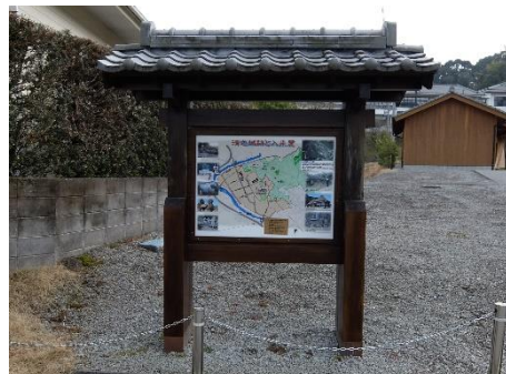
街なみ環境整備事業による整備箇所