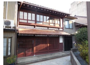
[ 修理後 ]