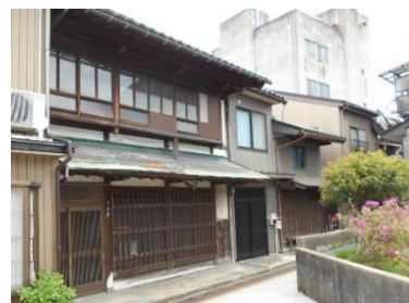
[ 修理前 ]

現在は地域コミュニケーションの場としての利用・活用も行いながら、空き家見学ツアーの開催、その他企画を開催している。(金屋町元気プロジェクト事務局 60代男性)