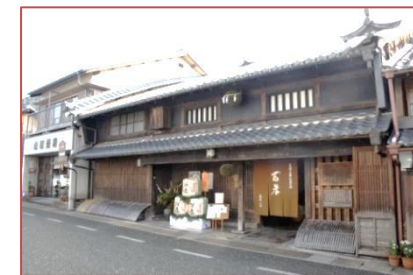
老舗:江戸時代から営まれる造り酒屋