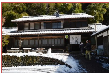
昭和初期の建物を改装したカフェ&ゲストハウス(樋ヶ洞)