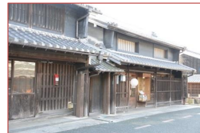
老舗:明治から営まれる和紙問屋