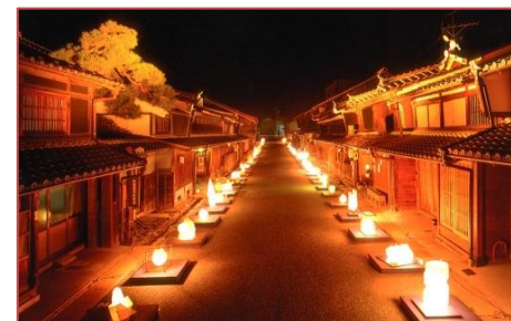
美濃和紙あかりアート展

うだつの上がる町並みが重伝建地区に選定される以前の、平成6年から開催されている美濃和紙あかりアート展は、毎年10月の第2土・日曜日の2日間開催されているが、このイベントは中高生、ライオンズクラブ、JC、商工会議所など地域の各団体から延べ400人へのぼるボランティアにより支えられている。うだつの上がる町並みに賑わいを取戻そう、活性化しようと地域住民の発案で始められた。美濃市を代表するこのイベントは、地域住民に支えられ、多くの人々を魅了している。