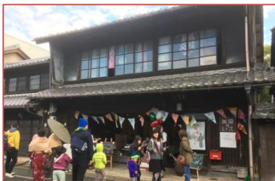
NPO法人多目的ギャラリー