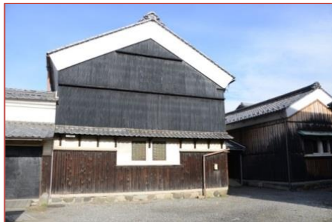
美濃和紙の原料蔵として使われた 旧松久邸別邸(上・下)

また現在、市が所有する旧美濃和紙原料蔵や数奇屋造りの建物を宿泊施設や和紙販売施設として改装が行われ、令和元年7月に開業した。