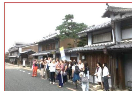
国際研修「紙の保存と修復」東京文化財研究所・ICCROMIにおける町並み案内ボランティア

うだつの上がる町並みを観光客に説明していく中で、最も意識していることは歴史的町並みを保存することだけではなく、各町内で営まれる伝統行事や風習を受け継いでいく住民の意識を伝えることである。美濃まつりや美濃流しにわか、夏に行われる秋葉様の祭礼などが一体となって守り、次の世代に伝えようとする住民意識があるからこそ、この町並みが維持されることを、多くの方々に説明している。