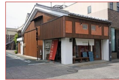
イタリアレストラン