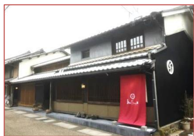
江戸時代の建物を改装した宿泊施設

保存地区から離れた樋ヶ洞地区や蕨生地区においても、歴史的建造物をカフェやゲストハウスに活用した建物が民間により開業しており、地区外にも歴史的建造物を活用したまちづくりが波及している。