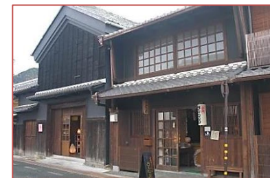
美濃和紙あかりショップ