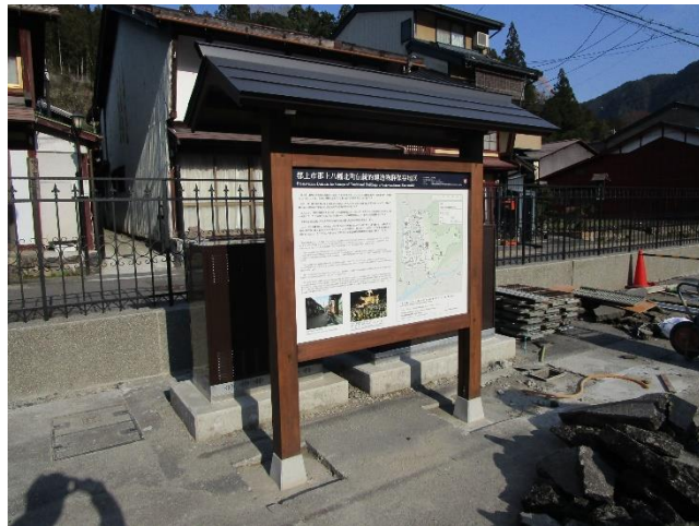
地区案内 看板(平成30年度設置)