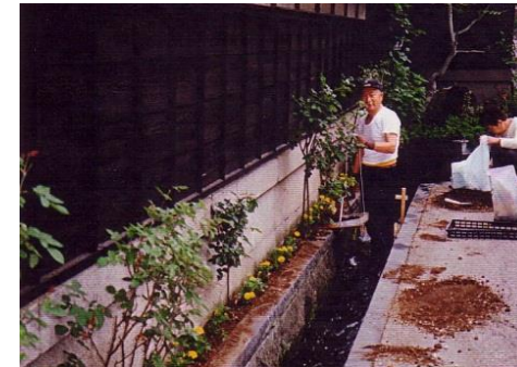
水路の清掃の様子