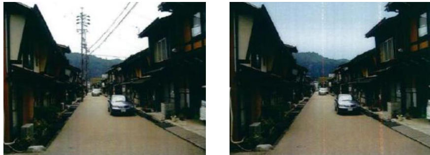
無電柱化事業 整備イメージ

平成26年2月14日「郡上市歴史的風致維持向上計画」が認定され、保存地区を中心とした整備を計画に基づき行っており、平成28年度より、保存地区において無電柱化事業、重点区域において空き家利活用事業、由緒書整備事業等を行っている。