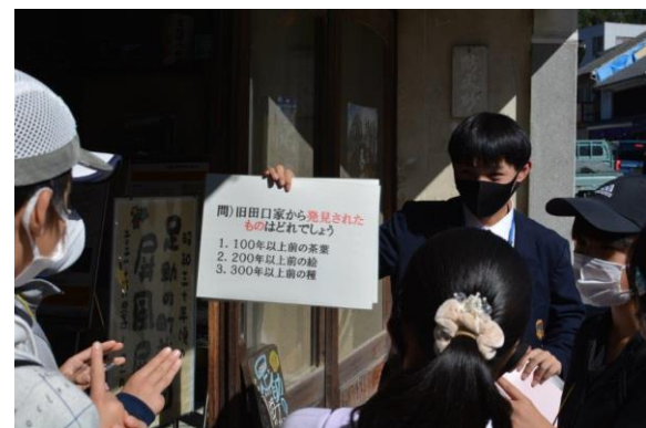
地元高校企画のシールラリーR3