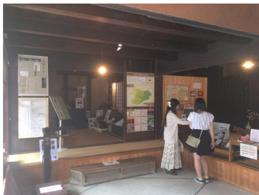
旧田口家住宅を町並み案内所として活用R3