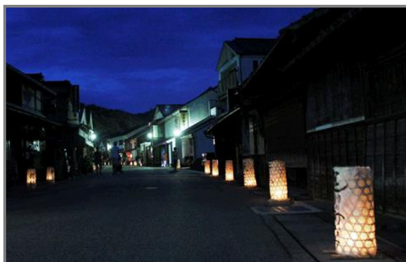
夏の「たんころりんの夕涼み」H14～