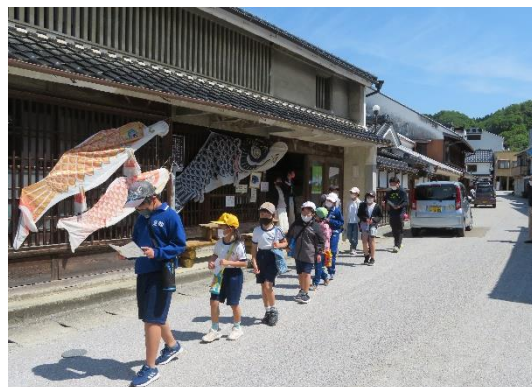
地元小学校町並み学習H25～