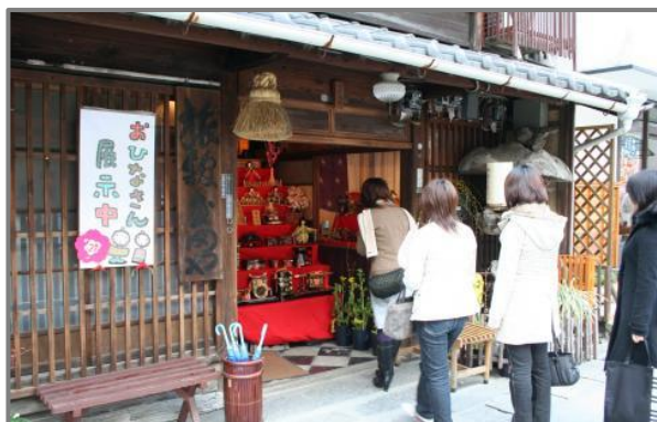
春の「中馬のおひなさん」H11～