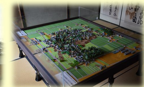
保存地区のジオラマ作成 (金堂まちなみ保存交流館)