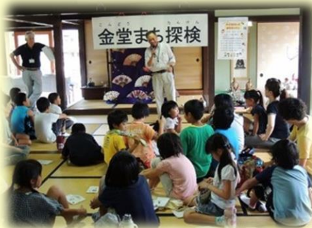
小学生対象の金堂まち探検

http://members.e-omi.ne.jp/kondo-machinami/index.html