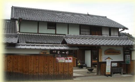
金堂まちなみ保存交流館