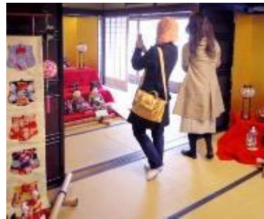
▲ちりめん街道ひなめぐり