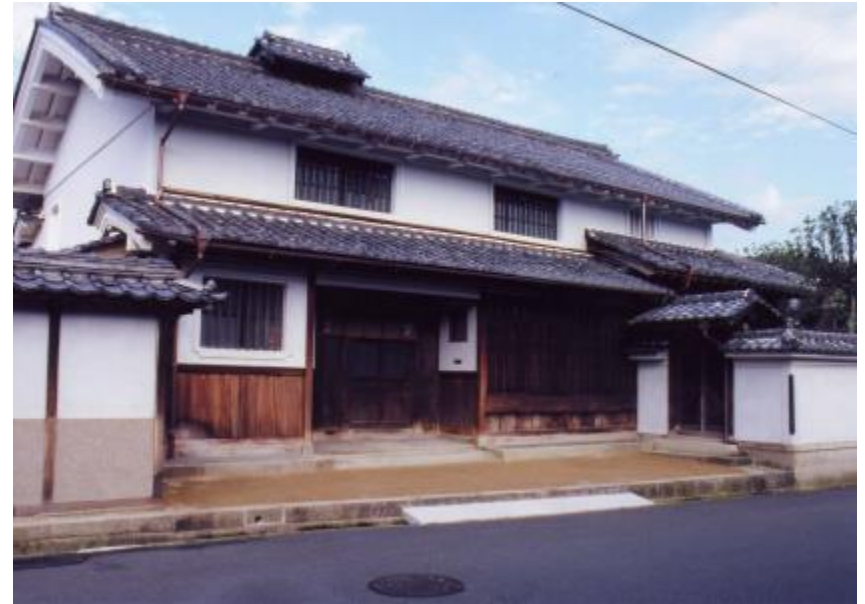
▲京都府指定文化財「旧尾藤家住宅」