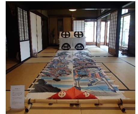
▲旧尾藤家住宅 企画展示