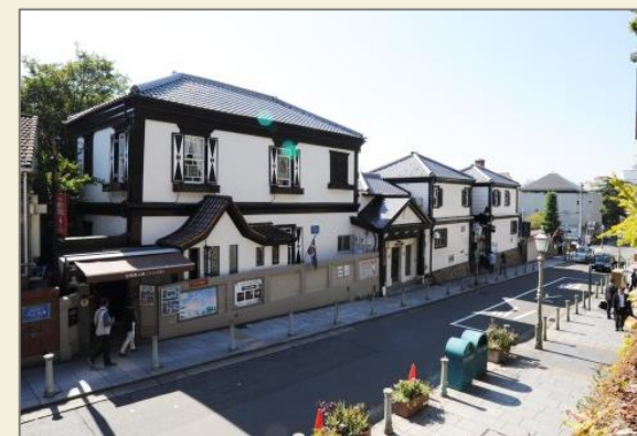
景観形成道路(北野通)