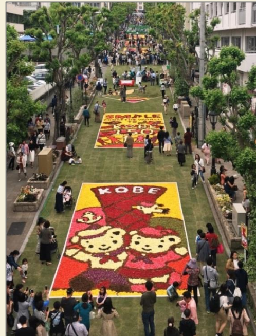
インフィオラータこうべ『北野坂』 市民ボランティアが花絵を作成 (毎年GW期間中に開催、約30万人が来訪)