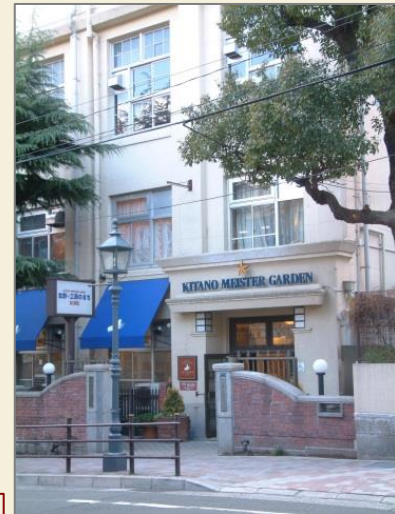
北野工房のまち (旧 北野小学校) 平成10年にオープン 市が管理運営事業者を公募し、 土地建物を賃貸

「神戸ブランドに出会う体験型工房」 としてオープン。旧校舎内で土産物の 買物やクラフト体験等ができる。 旧講堂は集会施設、旧校庭は、 大型観光バスの駐車場や地域 イベント等に利用されている。