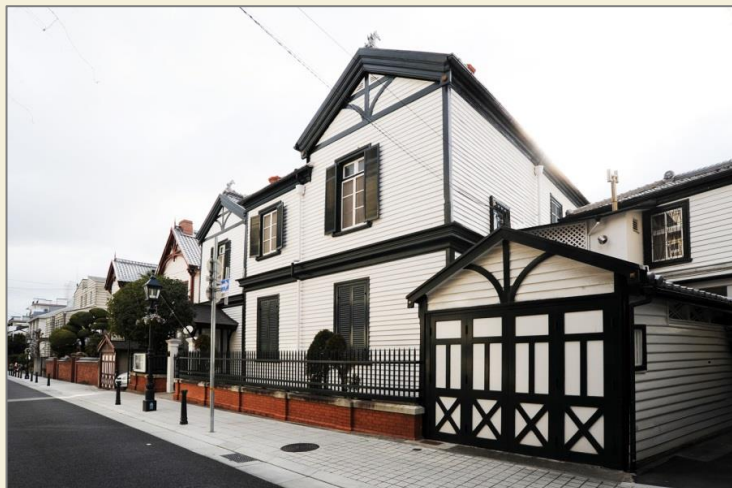
景観形成道路 (山本通)