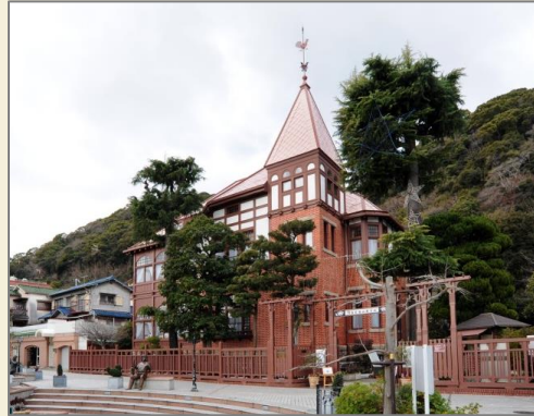
国重要文化財／旧トーマス住宅 (風見鶏の館)