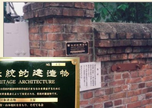
伝統的建造物の銘板設置