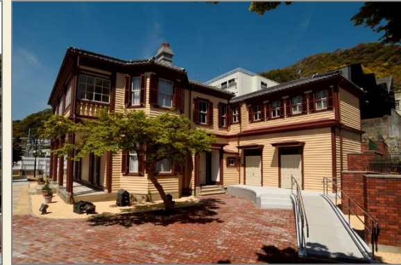
伝統的建造物／旧ドレウエル邸 (ラインの館)