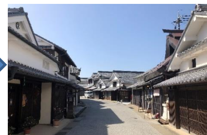
無電柱化後(篠山地区)