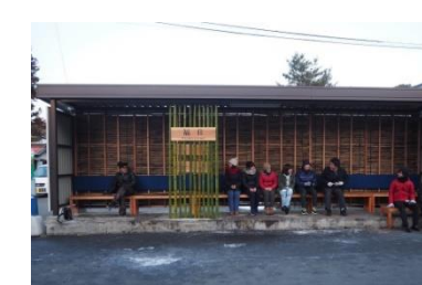
竹を活用したバス停修景