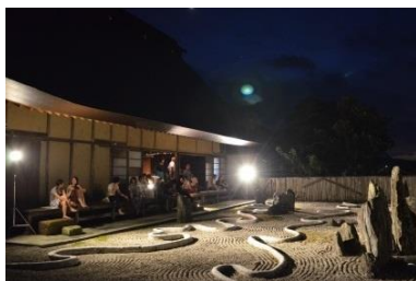
住吉神社ピアテラス