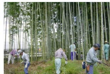
住民による竹林整備