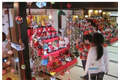
丹波篠山ひなまつり