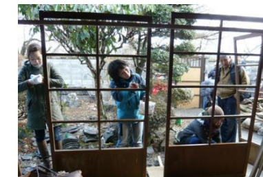
NPOによる古民家再生