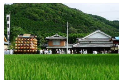
水無月祭(福住地区)