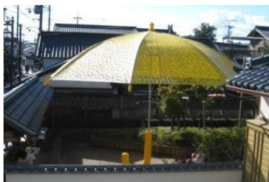
まちなみアートフェスティバル