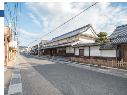
写真左： 矢掛ビジターセンター 問屋前