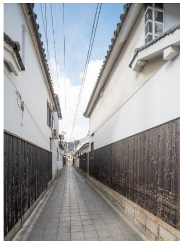
左上:旧矢掛本陣 石井家住宅 左下:旧矢掛脇本陣 高草家住宅 右:江戸時代から続く 専教寺小路