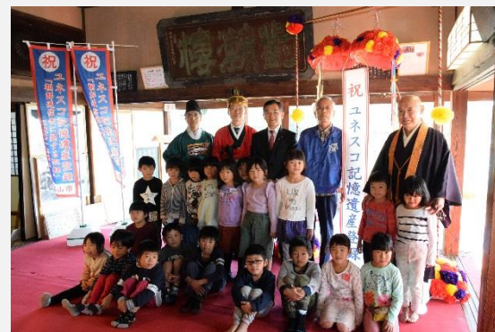
ユネスコ記憶遺産(世界の記憶)登録祝賀会