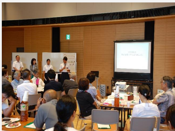
ワークショップ取組状況