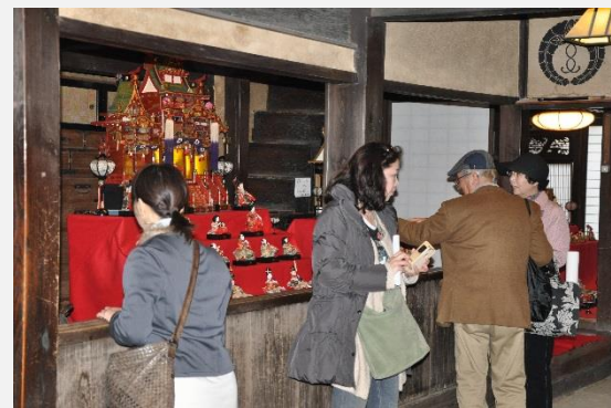
鞆・町並みひな祭り