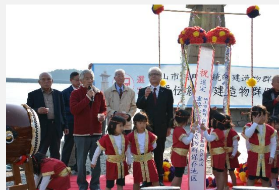
重伝建選定祝賀会