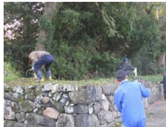
住民による清掃活動(堀内)