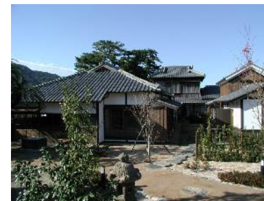
田中別邸旧宅整備(平安古)