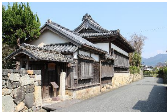
旧益田家物見矢倉

特徴 堀内は旧萩城三の丸にあたり、毛利輝元が慶長13年(1608)に指月山に城を築き、町割をおこなったことに始まる。保存地区は堀内のほぼ全域で、藩の諸役所(御蔵元・御木屋・諸郡御用屋敷・御膳夫所・御徒士所)と、毛利一門をはじめとする大身の武家屋敷が建ち並んでいた。近世城下町の武家屋敷としての地割が今もよく残り、土塀越しに見える夏みかんとともに歴史的風致を形成している。現在も、地区内には永代家老の益田家の物見矢倉など10数棟の武家屋敷が残る。