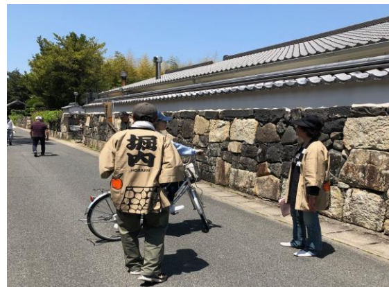
町内会の主催イベント 城下町萩・堀内散策