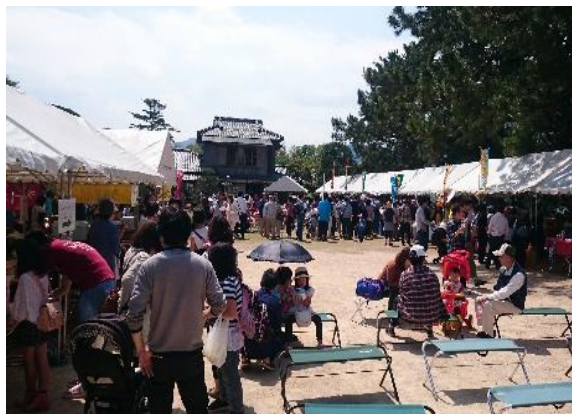
萩・夏みかんまつり(平安古)