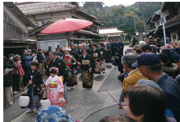
模擬結婚式(佐々並市)