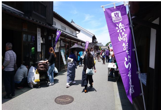
浜崎伝建おたから博物館