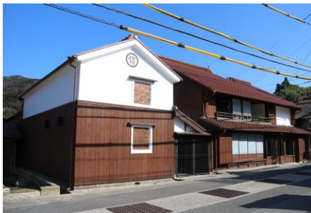
旧小林家住宅修理(佐々並)