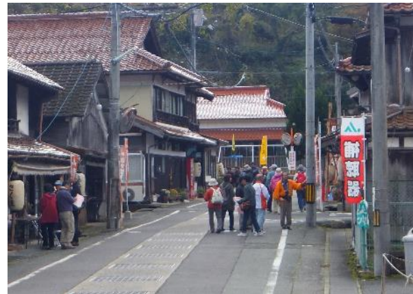
佐々並おいでん祭の 町並みガイド