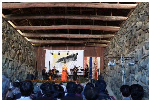
御船倉コンサート(浜崎)