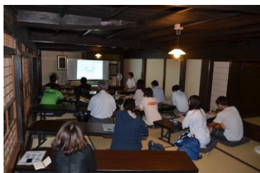
伝統的建造物での人材育成