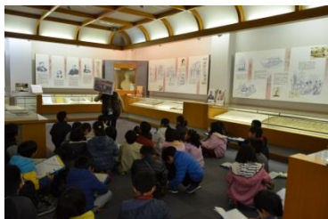
小学生の町並み学習