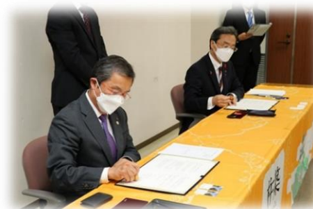
包括連携協定調印式