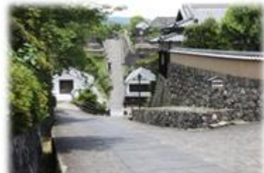
塩屋(志保屋)の坂と酢屋の坂