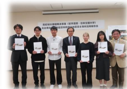
報告書を市長に贈呈