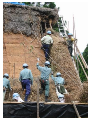
森林組合による 葺替え技術の伝承