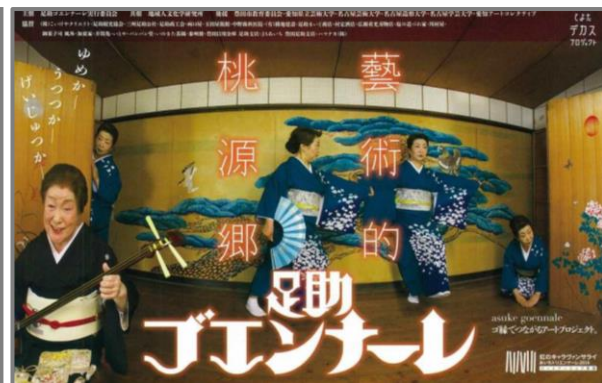
アートイベント「足助ゴエンナーレ」H26