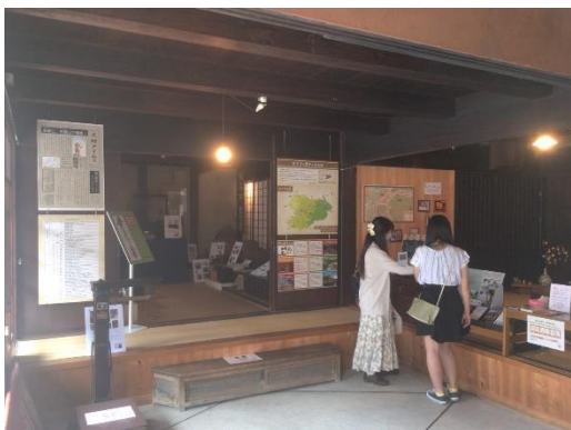
旧田口家住宅を観光案内所として活用R3～