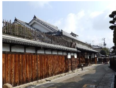
重文 旧杉山家住宅