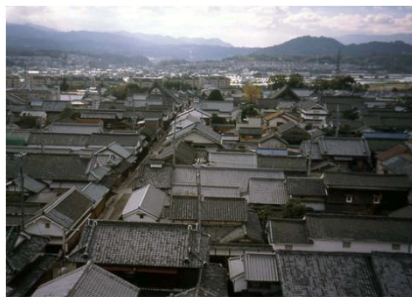
富田林寺内町 鳥瞰