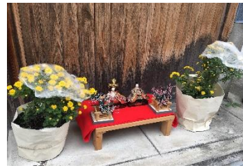
四季物語『秋』後の雛まつり