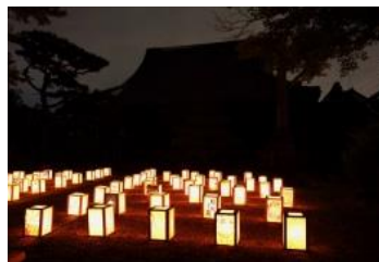
四季物語『夏』寺内町燈路