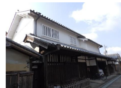
市立 寺内町センター