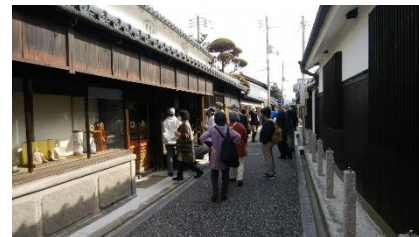
伝統的建造物の 見学会風景