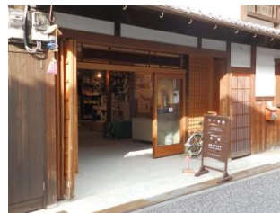
活用事例(住宅活用)