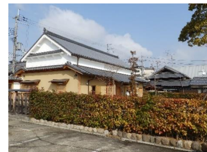
市立 じないまち展望広場