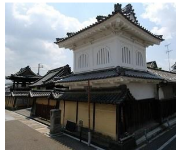
重文富田林興正寺別院