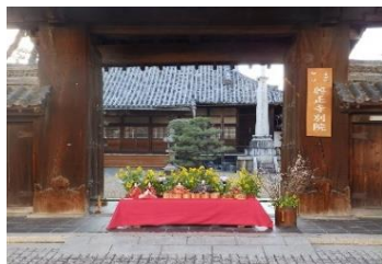
四季物語『春』雛めぐり

イベント等は、活動団体で組織されている「四季物語実行委員会」に於いて春・夏・秋・冬それぞれ季節に合った行事を実施している。また、活動されている各団体で「寺内町連絡協議会」が結成され、縦横の連絡を密にして取り組んでいる。