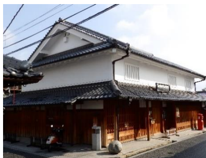
市立 じないまち交流館