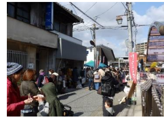
四季物語『冬』新春初鍋めぐり