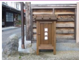
街かど消火器(防災事業)