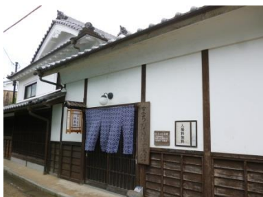
まちなみ伝承館(生活環境施設)

平成10年度 建物修景57件 ～ 生活環境施設2件 平成19年度 ふるさと事業1件 公園整備2件 防火水槽1件 案内板設置3件 電柱カラー化33件 道路・通路の美化化 下排水工事