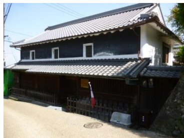
フレンチレストラン