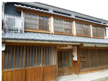
サテライトオフィス