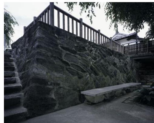
吉野川沿いに残る石垣