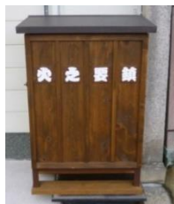
消火栓機材格納箱 (防災事業)