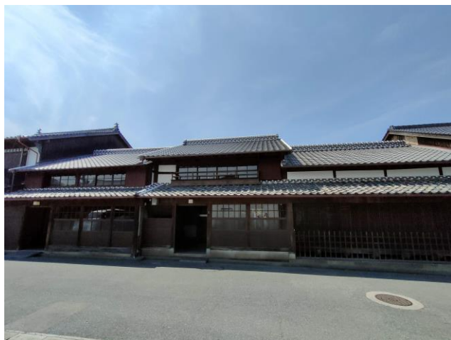
町家を改装したレストラン(浜崎)