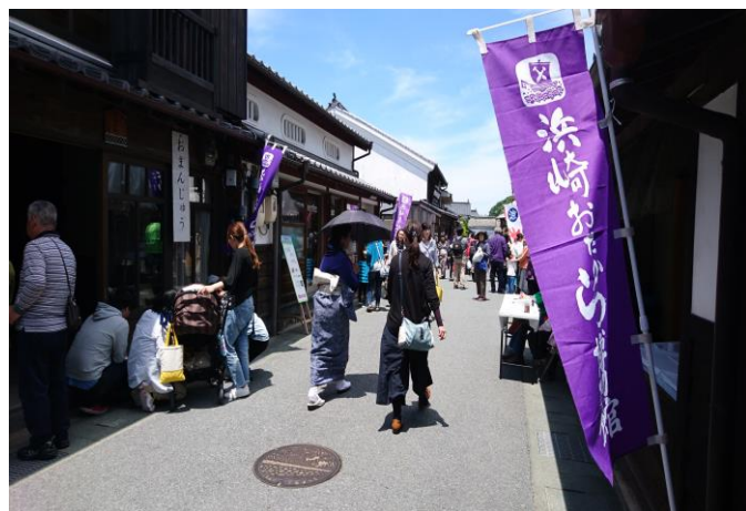
浜崎伝建おたから博物館