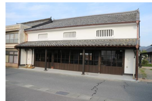
町家モデル保存整備(浜崎)