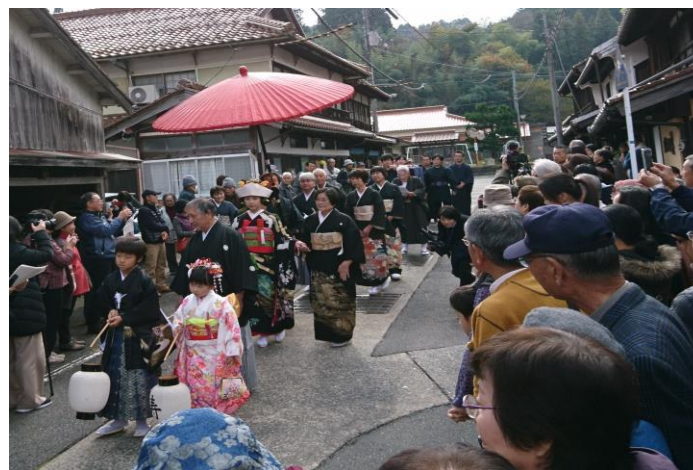
模擬結婚式(佐々並市)