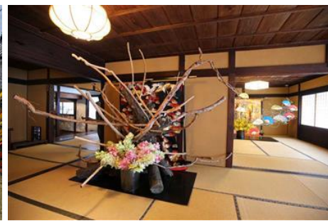
華道家假屋崎省吾「うだつをいける」