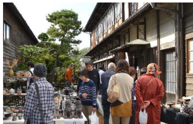
みやぎ村田町蔵の陶器市