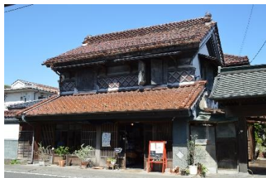
特定物件を活用した店舗