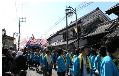
蔵の町むらた布袋まつり

平成29年度には、まちづくり会社が発足し、特定物件を活用した店舗等の開店を推進している。建築物の活用が促進され、地区内の交流人口の更なる増加が期待される。