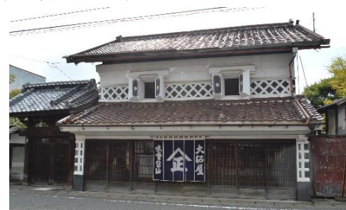
重要文化財旧大沼家住宅