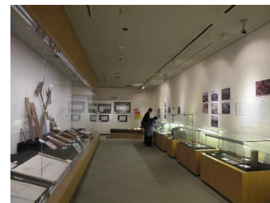
重伝建選定5周年記念企画展