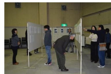
伝統様式調査報告会