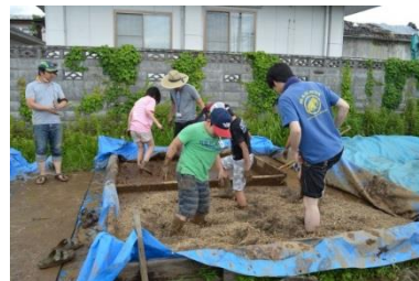
土壁づくり体験講座