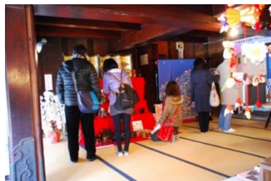
むらた町家の雛めぐり