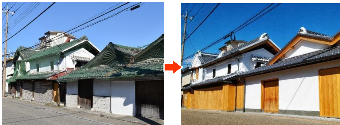
公開活用事業(拠点施設整備)